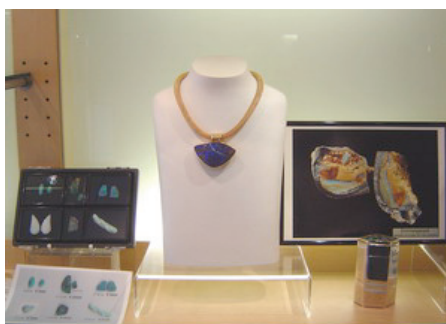
Leuchtende Opale, verarbeitet zu einmaligen Schmuckstücken