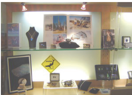
Dinosaurierwirbel opalisiert, ca. 120 Mio. Jahre alt