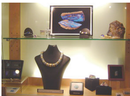
"Das blaue Pärchen"